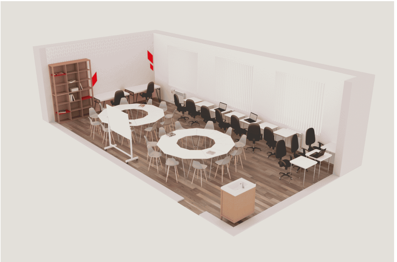
Помещение для проектной деятельности, зонированное по принципу коворкинга, включающего шахматную гостиную, медиазону